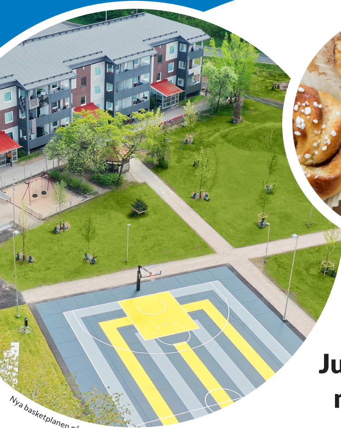
Nya basketplanen på området Trasten i Gislaved